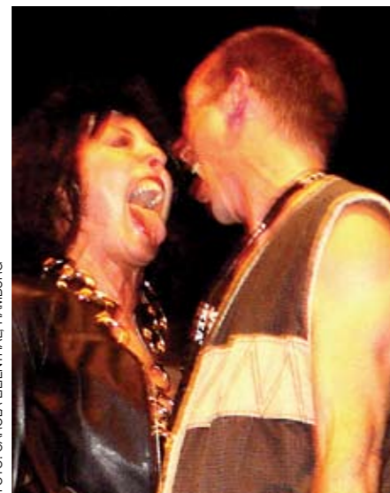
»Frieden ist was für Weicheier« Echte Krieger brauchen den Gegner direkt auf Augenhöhe.